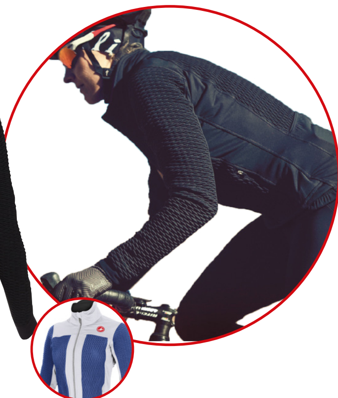
Bleu et Blanc